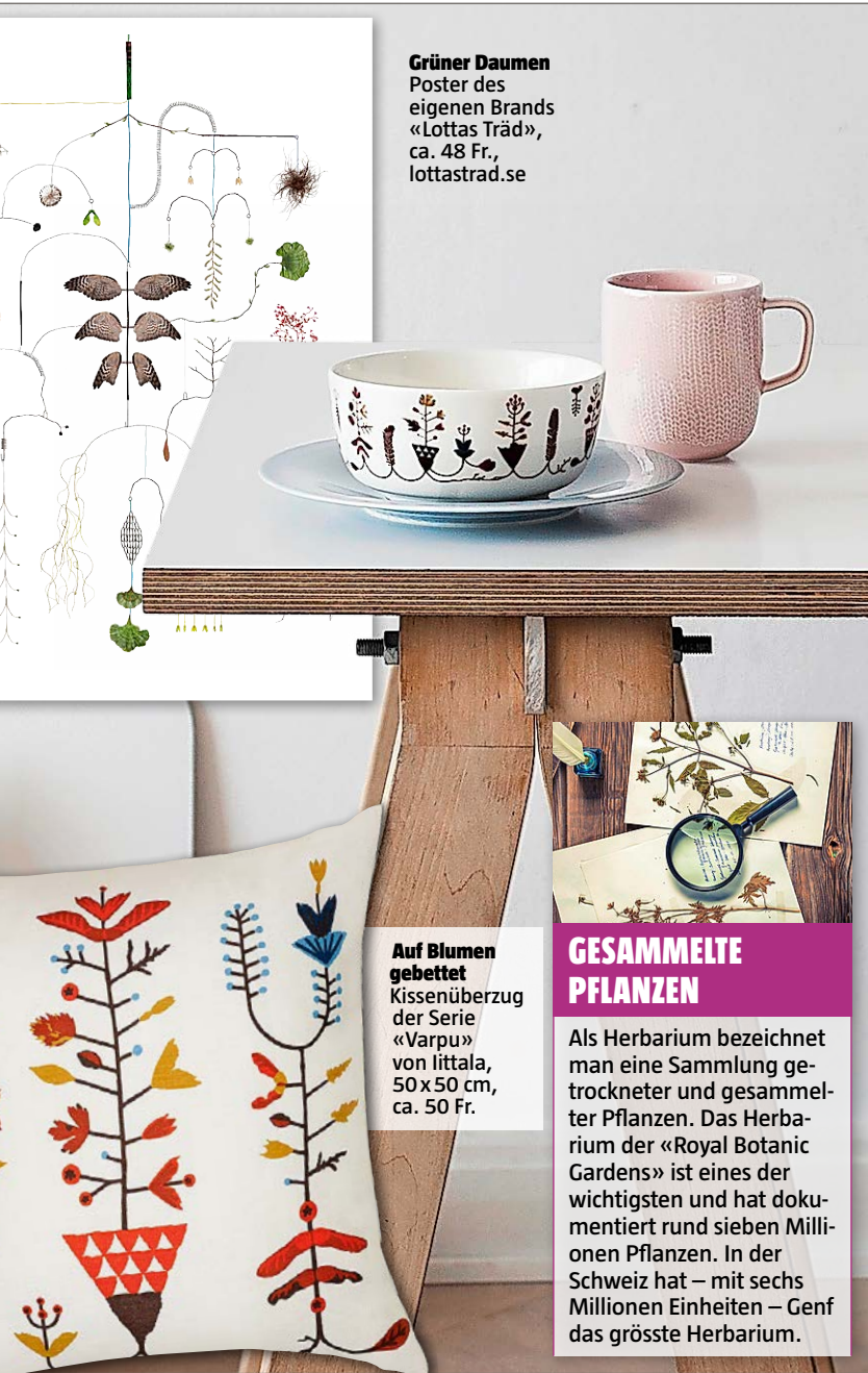
Grüner Daumen Poster des eigenen Brands «Lottas Träd», ca. 48 Fr., lottastrad.se