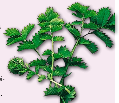
Frisch Pimpinelle passt gut zu Marinaden oder einem Salat.

Pimpinelle → Das wintergrüne, mehrjährige Kraut gedeiht in fast jeder Gartenerde. Früher wurde es als Heilkraut gegen Verdauungsprobleme verwendet, heute ist es in der Küche eine ideale Zutat zu Salaten, Drinks, Marinaden, grünen Saucen, aber auch zu Fleisch und Fisch (dann nicht mitkochen, sondern erst vor dem Servieren begeben). Die zarten grünen Blättchen schmecken leicht nach Gurke.